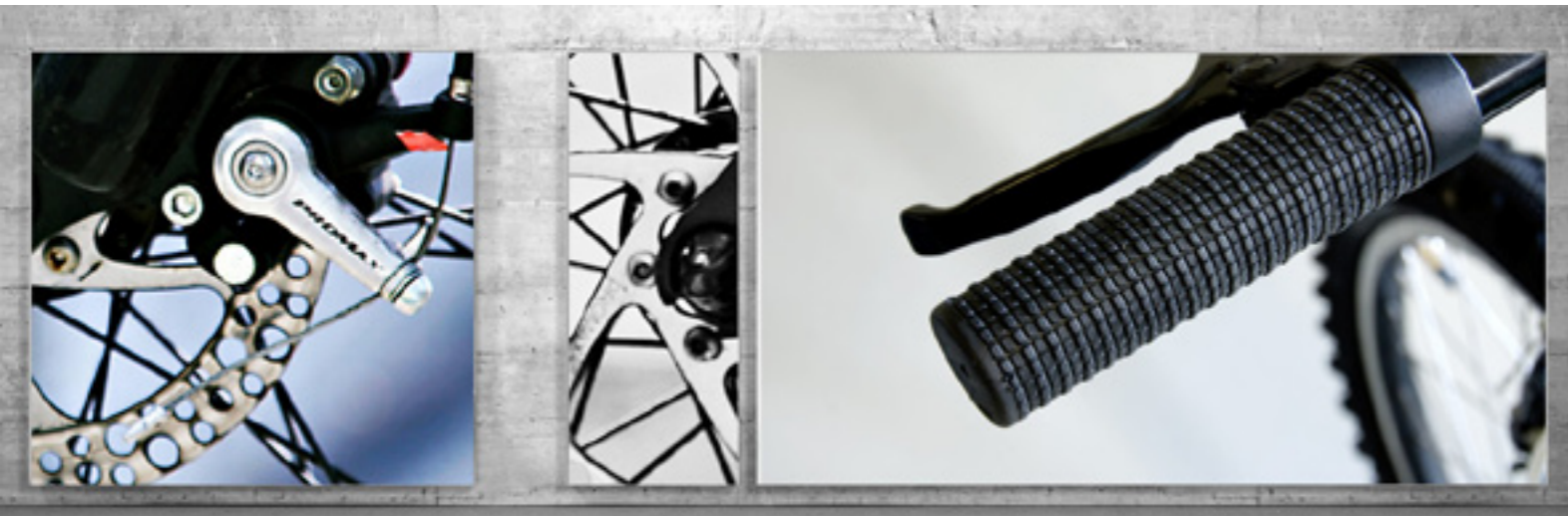
Variationen verschiedenster Motive auf den einzelnen Flächen ...