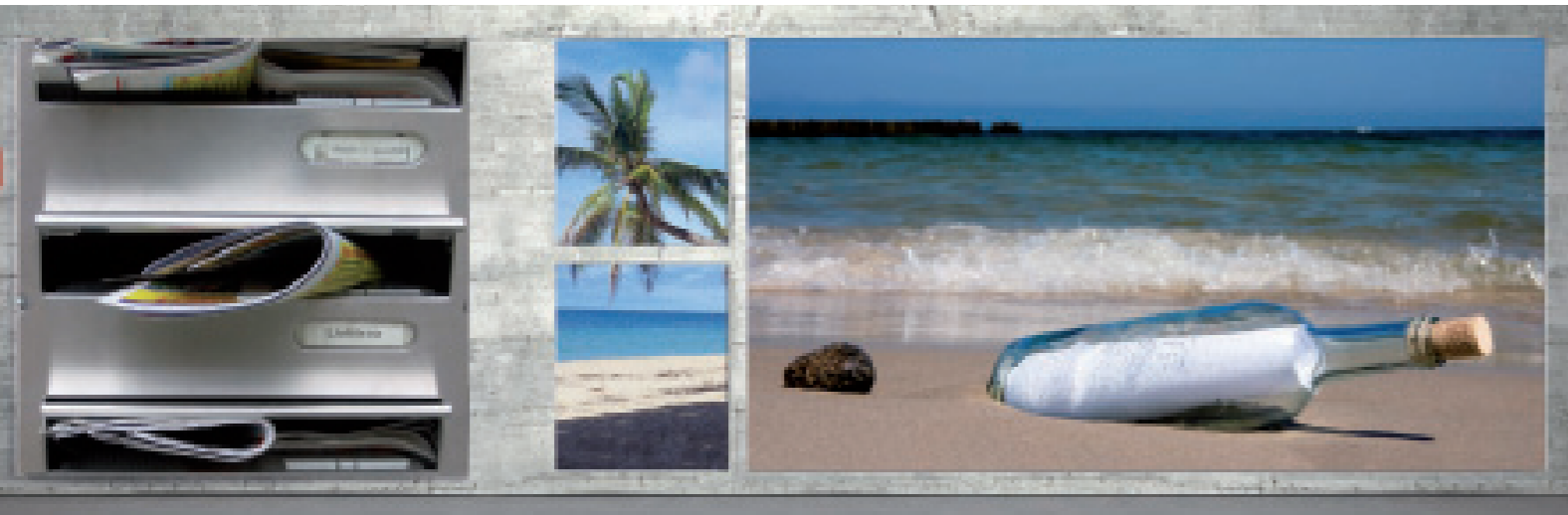
Variationen verschiedenster Motive auf den einzelnen Flächen ...

... neben- und übereinander, alleinstehend oder Motiv übergreifend.